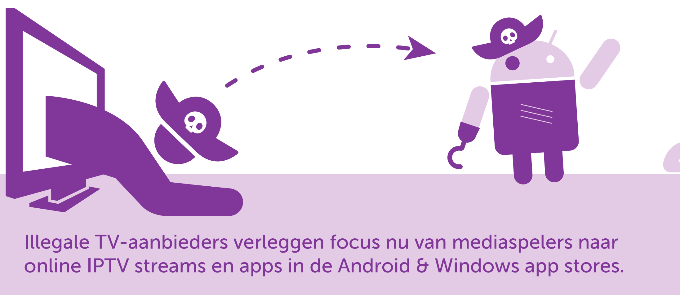
Illegale TV-aanbieders verleggen focus nu van mediaspelers naar online IPTV streams en apps in de Android & Windows app stores.